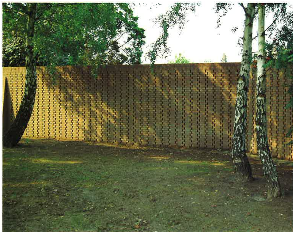
Tuinmuur van het museum van de Pont Stichting, Tilburg (Bentham Crowwel Architecten)