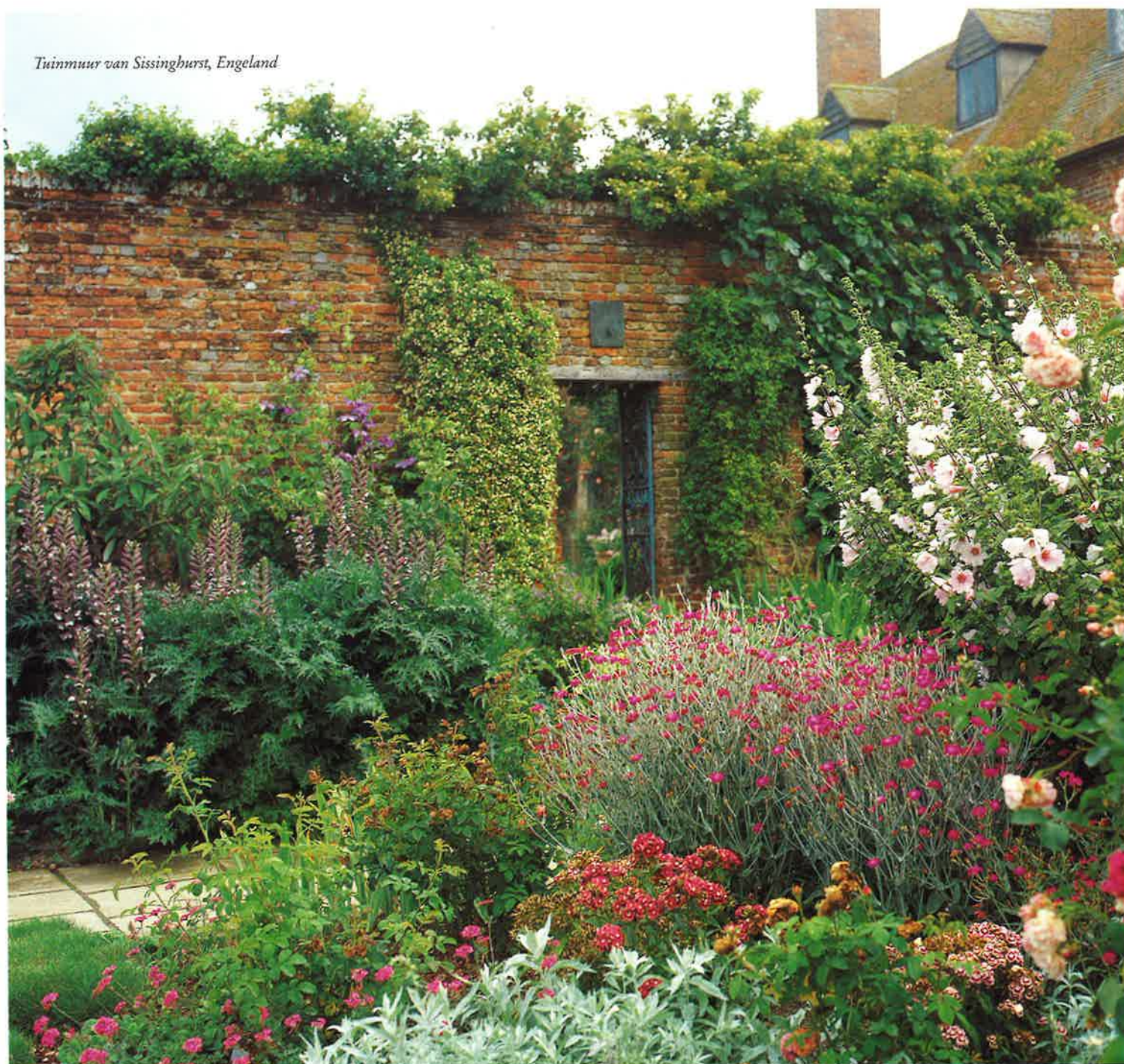
Tuinmuur van Sissinghurst, Engeland