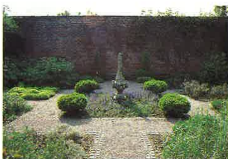
Arley Hall, Engeland