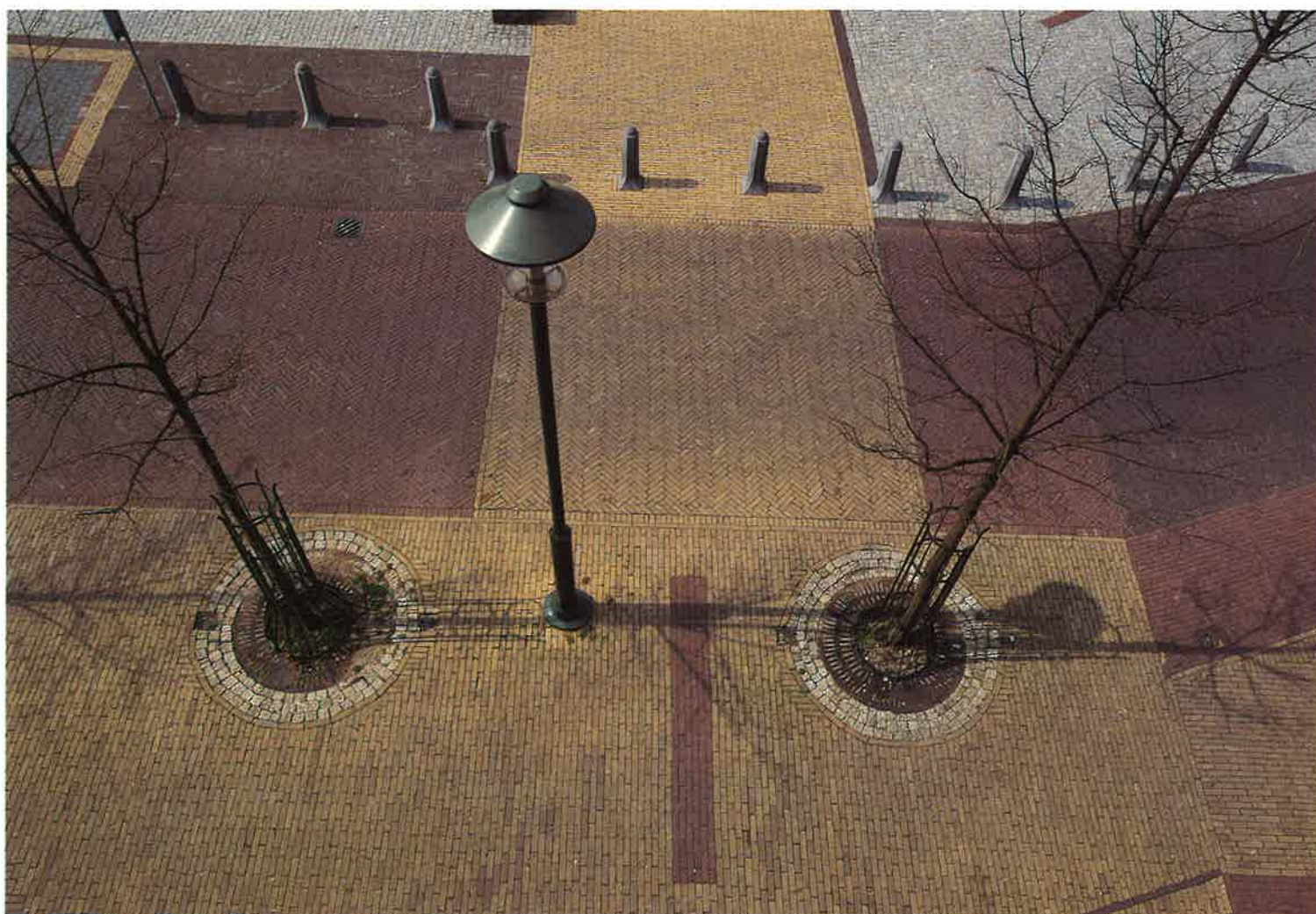
Inrichting openbare ruimte Gemeente Doorn

tussen gemeenten is de inrichting van de openbare ruimte een middel in de strijd geworden, allemaal om zich een identiteit toe te eigenen.'