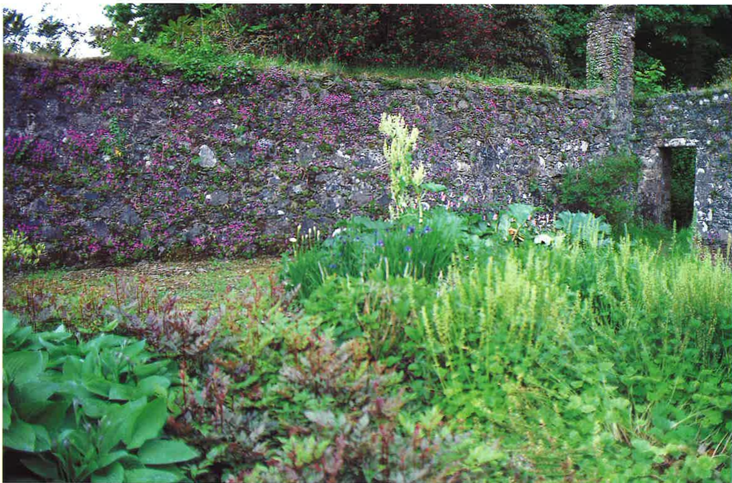
Kennedy Castle, Engeland

mode van de landschapstuin, de 'natuurlijke' tuin, waarbij het ideale tuinlandschap eruit zag als een imitatie van de natuur rondom. Dit bracht met zich mee dat men doorzichten nodig had op die natuur. Ongewenste gasten, menselijk of dierlijk, dienden echter nog steeds geweerd te worden, waardoor een barrière nodig bleef. De landschapsarchitect William Kent introduceerde een vernuftige oplossing: de eerder genoemde ha-ha. Door de verzonken ligging was er onbelemmerd uitzicht op de omringende natuur, terwijl in de greppel soms een muur werd geplaatst die alsnog binnendringers tegenhield.