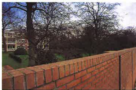
Slangemuur bij Kasteel Zuylen (linksboven) en een nieuwe tuinmuur rondom nieuwbouwcomplex in Wassenaar

Toch voelde men vaak de noodzaak om een oog op die buitenwereld te houden: vanaf de late Middeleeuwen bouwde men priëlen op de hoeken van de ommuurde tuinen, zodat